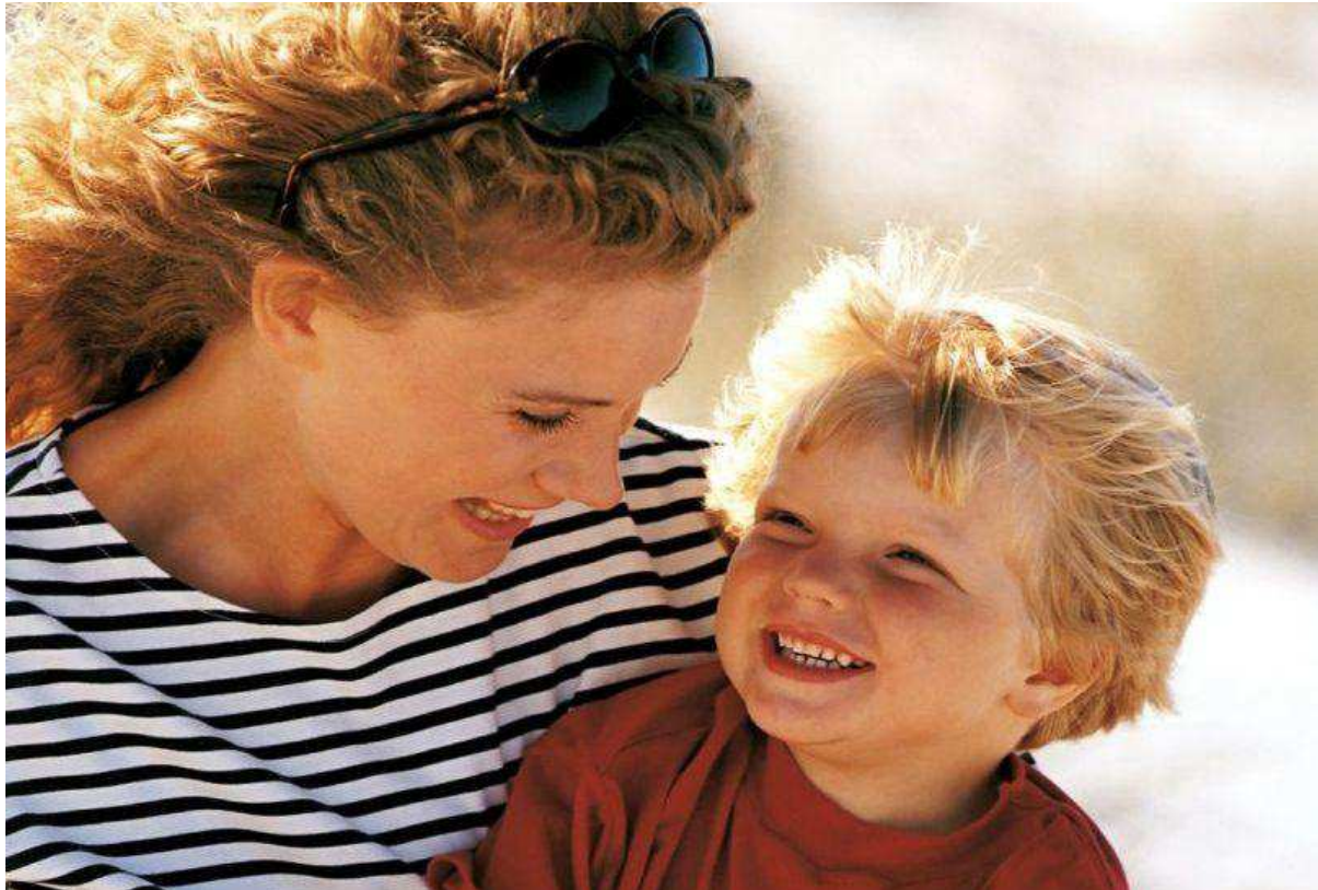
Képünk illusztráció, nem a cikk szereplőit ábrázolja

Amíg az OECD-országokban a háromévesnél fiatalabb gyereket nevelő nők fele dolgozik, addig itthon mindössze a 15 százalékuk. A kisgyermekesek nem azért nem dolgoztak, mert ez szerintük az anyasággal nem fér össze. A gyes sokszor megnehezíti a nők munkába állását, gyakran a munkáltató nem tesz ez idő alatt eleget a kötelezettségének. A kismamák életében gyakori probléma, amikor egy-két év babázás után újból szeretnének munkába állni, de nem tudják, mihez van joguk és mihez nincs, mit kell elfogadniuk és igaz-e az, amit a munkáltatójuk állít az átszervezésről, az üres álláshelyek számáról vagy éppen a létszámleépítésről.